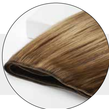
Larga 1 metro