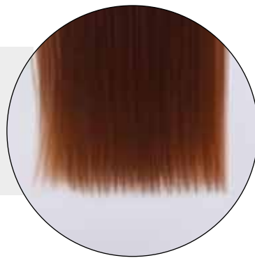
Capelli quadrati e pieni fino alle punte